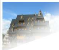
Dom wczasowy Tulipan