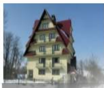
Dom wczasowy Tulipan